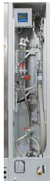
Système de lavage pour la purification des gaz d'échappement du processus par lavage