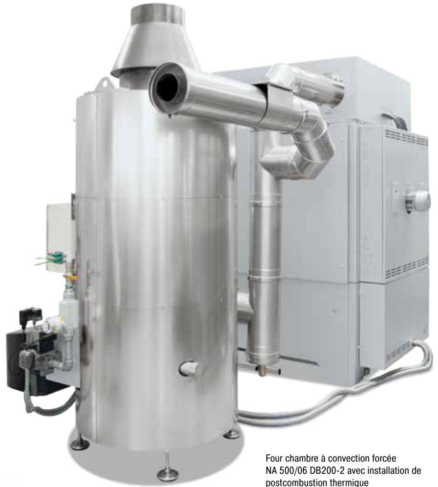
Four chambre à convection forcée NA 500/06 DB200-2 avec installation de postcombustion thermique