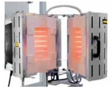
RS 100/250/11S en version ouvrante à monter dans un dispositif de contrôle

Construits selon nos modèles standards, nous développons des solutions individuelles également pour l'intégration dans les installations de process supérieures. Les solutions présentées sur cette page ne représentent qu'un échantillon des possibilités. Nous trouvons toujours la solution appropriée à l'optimisation d'une application, que ce soit du travail sous vide ou sous atmosphère protectrice jusqu'aux températures, tailles, longueurs et propriétés les plus diverses des installations de fours tubulaires en passant par une technologie innovante de régulation.