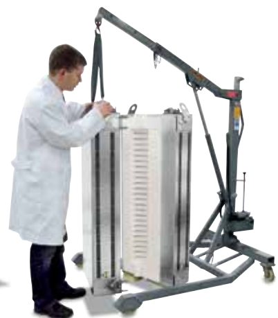
RS120/1000/11S en version séparée. Les deux demi fours sont fabriqués à l'identique et seront intégrés à un système de chauffage au gaz existant, dans un concept de gain de place