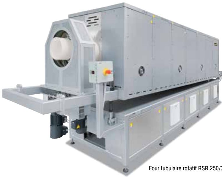
Four tubulaire rotatif RSR 250/3500/15S