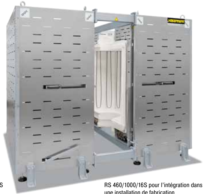
RS 460/1000/16S pour l'intégration dans une installation de fabrication

Grâce à un degré élevé de flexibilité et d'esprit innovant, Nabertherm propose la solution optimale pour applications sur mesure.