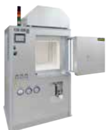
HT 160/17 DB200 pour le déliantage et le frittage de céramiques après l'impression 3D

La fabrication additive permet de convertir directement des fichiers de conception en objets pleinement fonctionnels. Avec l'impression 3D, les objets en métal, matière plastique, céramique, verre, sable ou autres matériaux sont élaborés par couches successives jusqu'à qu'ils aient atteint leurs formes finales.