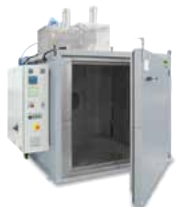
Étuve de séchage KTR 2000 pour polymérisation après impression 3D