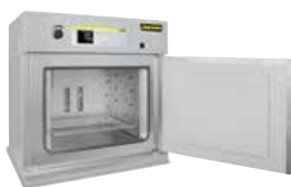
Étuve TR 240 pour le séchage des poudres