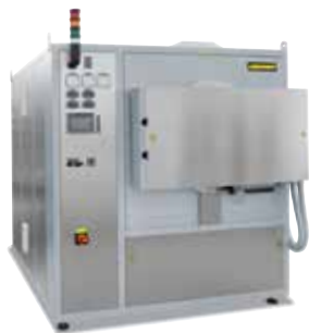
Four moufle étanche NR 150/11 pour le recuit de détente de pièces métalliques après l'impression 3D