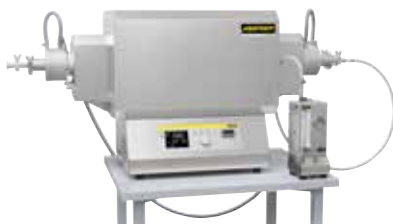
Four tubulaire compact pour le frittage ou le recuit de détente après l'impression 3D sous gaz protecteur ou sous vide