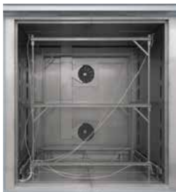
Cadre de cartographie adapté pour four à chambre à circulation d'air N 7920/45 HAS

On entend par homogénéité de température un écart maximal de température défini dans l'espace utile du four. On distingue, d'une manière générale, la chambre de four et l'espace utile. La chambre de four est le volume disponible en totalité dans le four. L'espace utile est plus petit que la chambre du four et décrit le volume pouvant être utilisé pour le chargement.