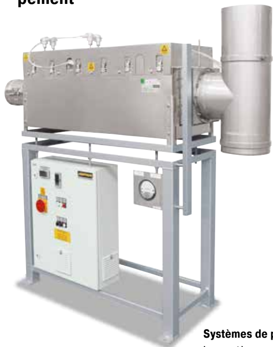
Postcombustion catalytique en fonction du four pour le post-équipement sur des installations existantes

Pour purifier l'air, en particulier lors du déliantage, Nabertherm propose des systèmes de purification des gaz de combustion calqués sur le processus. Le système de postcombustion est raccordé fixement aux manchons des gaz d'évacuation du four et intégré à la régulation et à la matrice de sécurité. Pour les installations de four existantes, Nabertherm peut proposer des systèmes de purification des gaz de combustion indépendants du four, à régulation et fonctionnement séparés.