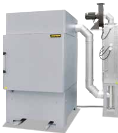
Four chambre à convection forcée NA 500/65 DB200 avec installation de postcombustion catalytique