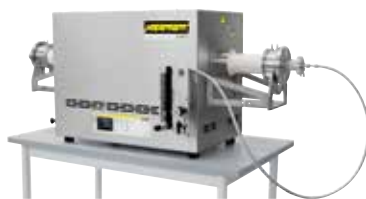
Four tubulaire compact pour le frittage ou le recuit de détente après l'impression 3D sous gaz protecteur ou sous vide