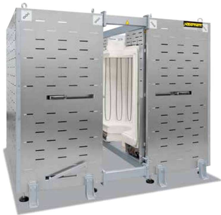
RS 460/1000/16S pour l'intégration dans une installation de fabrication