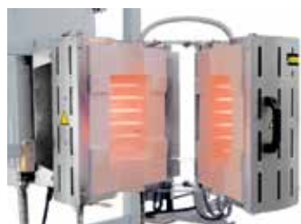
RS 100/250/11S en version ouvrante à monter dans un dispositif de contrôle

Grâce à un degré élevé de flexibilité et d'esprit innovant, Nabertherm propose la solution optimale pour applications sur mesure.