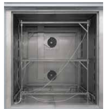
Cadre de cartographie adapté pour four à chambre à circulation d'air N 7920/45 HAS