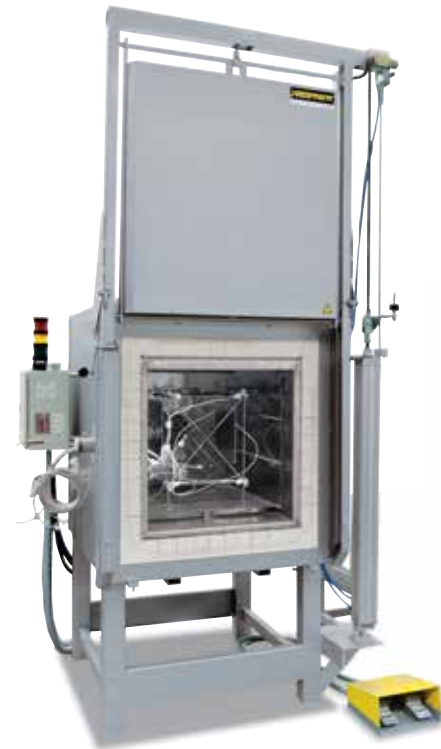
Bâti de mesure pour déterminer l'homogénéité de température

Pour le four standard, une homogénéité de température en +/- K est garantie sans que le four soit mesuré. Il est néanmoins possible de commander en option une mesure d'homogénéité de température avec une température de consigne dans l'espace utile selon la norme DIN 17052-1. Suivant le modèle, un bâti correspondant aux dimensions de l'espace utile, sera placé dans le four. Sur ce bâti seront fixés des thermocouples à 11 positions de mesure définies. La homogénéité de température sera mesurée en présence d'une température de consignée prescrite par le client après un temps de maintien défini au préalable. Suivant les exigences, il est également possible de calibrer des températures de consigne diverses ou une plage de travail de consigne définie.