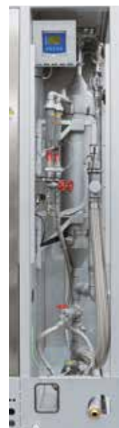
Système de lavage pour la purification des gaz d'échappement du processus par lavage

Le système d'épuration des gaz d'échappement s'utilise fréquemment si les gaz d'échappement générés ne peuvent pas être efficacement post-traités par une torche de brûlage ou par un processus thermique. Les composants indésirables contenus dans le gaz d'échappement sont séparés dans la section de contact de l'épurateur par le biais d'un liquide d'épuration. Le choix du liquide ainsi que la conception de l'alimentation et de la section de contact permettent d'adapter l'épurateur au processus et d'éliminer efficacement les substances gazeuses, liquides ou même solides contaminant le gaz d'échappement.