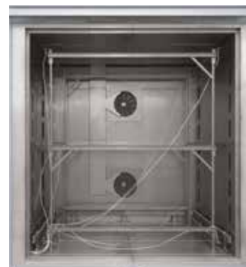
Cadre de cartographie adapté pour four chambre à circulation d'air N 7920/45 HAS