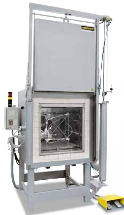
Bâti de mesure pour déterminer l'homogénéité de température

Pour le four standard, une homogénéité de température en +/- K est garantie sans que le four soit mesuré. Il est néanmoins possible de commander en option une mesure d'homogénéité de température avec une température de consigne dans l'espace utile selon la norme DIN 17052-1. Suivant le modèle, un bâti correspondant aux dimensions de l'espace utile, sera placé dans le four. Sur ce bâti seront fixés des thermocouples à 11 positions de mesure définies. La homogénéité de température sera mesurée en présence d'une température de consignée prescrite par le client après un temps de maintien défini au préalable. Suivant les exigences, il est également possible de calibrer des températures de consigne diverses ou une plage de travail de consigne définie.