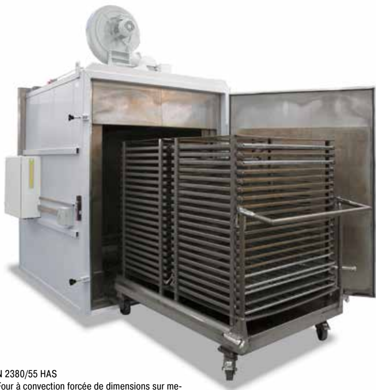
N 2380/55 HAS Four à convection forcée de dimensions sur mesures avec navette de chargement pour le revenu de tôles plates