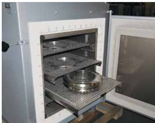
Four à circulation d'air avec plateaux de chargement sur plusieurs niveaux. Les plateaux sont placés chacun sur des rails télescopiques et peuvent être sortis un à un.

Système de four chambre double composé de deux fours à convection forcée N 60/65 HA avec ouverture électrique des portes pivotantes pour le refroidissement et le chargement facilité du four.